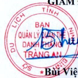
* Bùi Việt Thắng